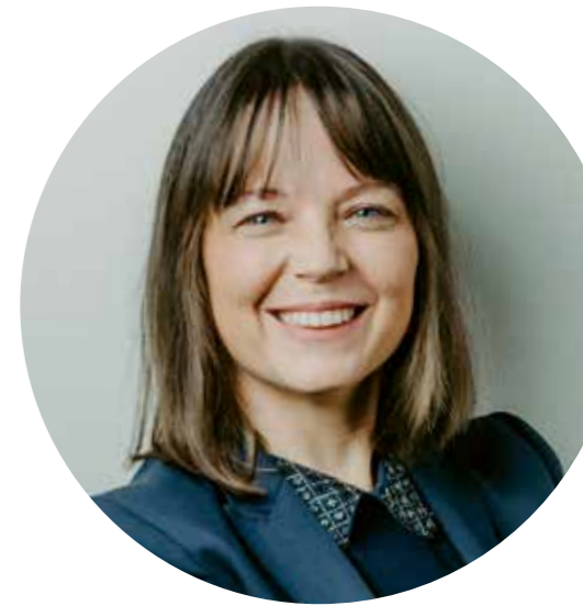
“De ontwikkeling naar inclusiever onderwijs moeten we als regio samen oppakken.”

“Samen zetten we ons in voor de best passende onderwijsplek voor kinderen voor wie schoolsucces niet vanzelfsprekend is”